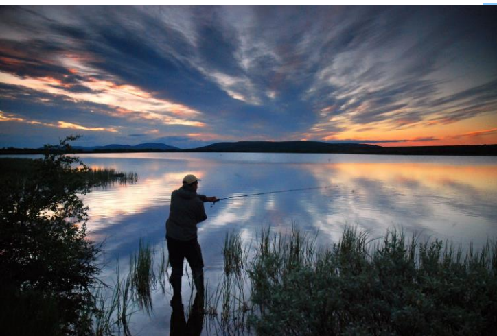
Foto 1: femundengerdal.no/Tore Stengrundet, Foto 2/3: Ville Gleder